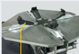
G800A98 → 22" (4 x kit) G800A6 → 26" (4 x kit)