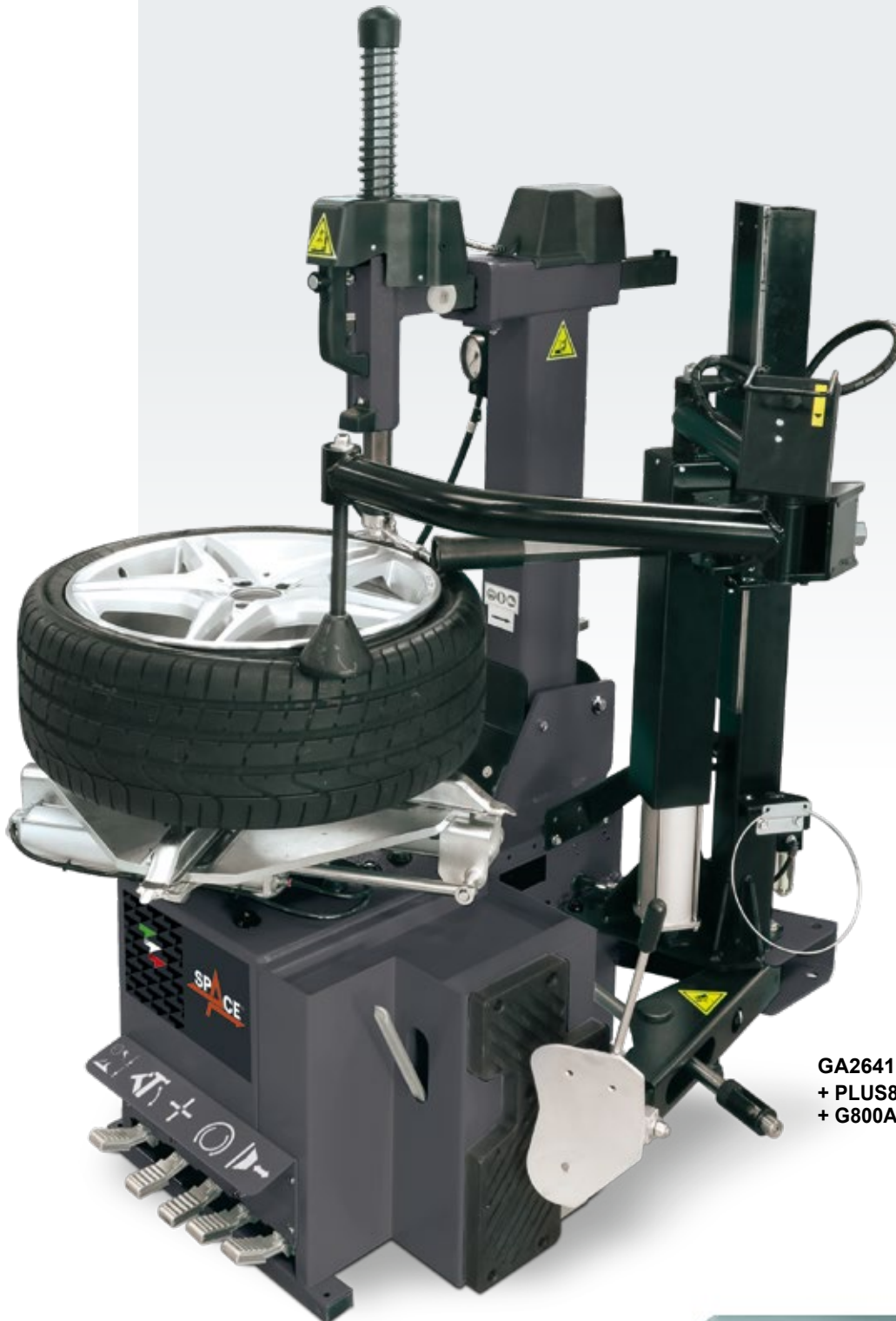
GA2641.22 + PLUS83H Helper + G800A123 Inflation by pedal