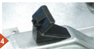
4 Nuova griffa standard con aderenza ottimizzata e punte sostituibili. New standard high adherence clamp with renewable spikes.

Neue Spannklaue mit optimaler Rutschfestigkeit und austauschbaren Haltekörner.