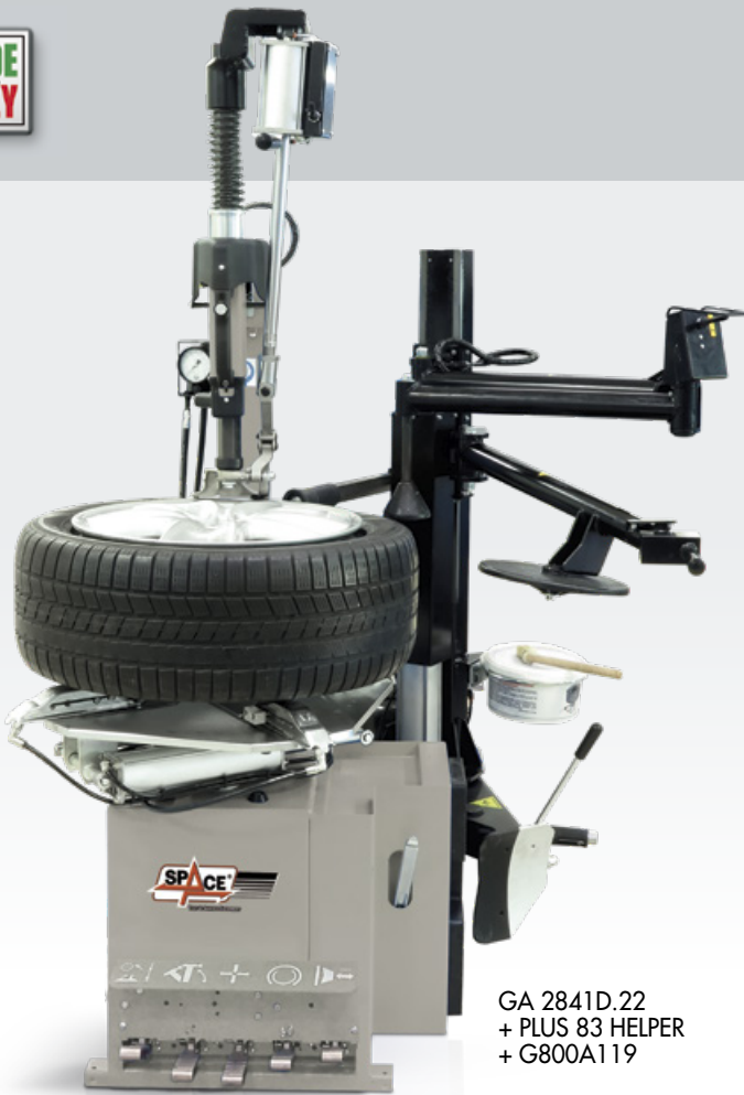
GA 2841D.22 + PLUS 83 HELPER + G800A119

COMPANY WITH QUALITY SYSTEM CERTIFIED BY DNV GL = ISO 9001 =