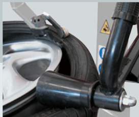
GA405.EL + PLUS 80CL (helper)